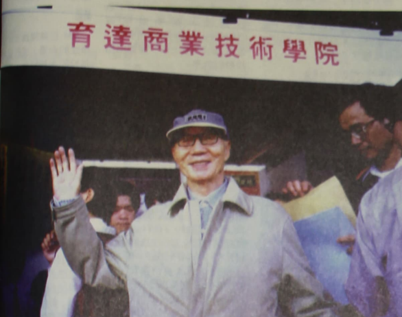
育達商業技術學院

創辦人賀歲詞： 再幾天，就是咱們中國人的新年；一般人的習慣，認為過了舊曆年，「新年」才真正開始。在此，向全校同仁和同學拜個早年，祝大家除舊佈新，一馬當先。 這一個月，我個人特別感到開心，就是圖書館資訊大樓完工落成，去年此時，我們平地起高樓，眼一睜，一瓦慢慢地砌，十一個月後，我們有了先進的圖書館以及國際級的會議中心。學校的硬體結構甚見完備，希望全校師生員工能夠善用資源，讓育達技術學院不僅僅有一流的設備，更有素質一流的教師、職員及學生。 我講過：育達學院將是我從事半世紀教育事業的句點。我親身十年的經驗，一生的心血，即足「軟硬兼施」，就是要為育達團隊中年輕的成員一育達商業技術學院一開創最典範的規模。經常風靡僑、南北奔馳，不知老之已至。如最近為了改善師資結構，和黃校長兩人只要聽說某一專業且卓越的人選，不管南下北上，總是親自造訪，三顧茅廬的情形亦不在少數。 我們更進行了一個「翰林計劃」，以便招募更多優秀的菁英來校任教。我創辦人雖下重金，目的都是為了讓同學們在良好的環境中受到最好的教育。 我沒有一天忘記創辦這所學校的初衷與願景，因此夙夜匪懈，却也樂在其中。回顧過去辛巳年的每一天，莫不動動慙慙，還以迎新送舊之際，如果跟自己算算帳，我可以很欣慰，可以很無憾地說：做為育達商業技術學院的創辦人，面對學校的願景，已盡了自己的那一份責任，其餘的就等著我們的同仁和同學如何完成了！與各位共勉。