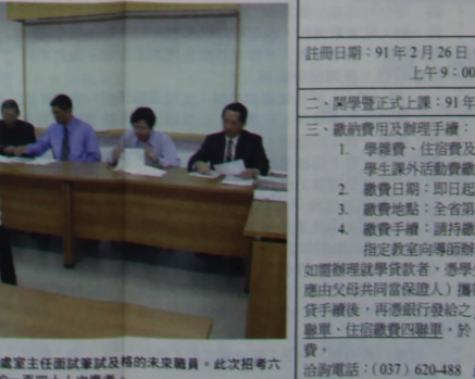
▲校長(中)及各處室主任面試適任及格的未來職員。此次招考六名職員，計有約一百四十人次應考。

【本報訊】為提高學校各單位行政效率，提升校務處理品質，本校人事室積極著手增聘人事編制事宜，於一月二十二日於校內公開舉辦行政人員統一筆試。再於一月十七日舉行第二階段面試。統計總應考人數約為一百四十名，而本校招考職員人數僅六名，顯現有相當多的求職者競相角逐本校職員缺額。 本學期以來由於全校師生人數增加，各單位行政業務亦隨之增加，本校人事室於各大報刊登徵聘行政人員公告，徵求大專以上具備實務經驗、熟悉校務處理或相關科系之人才，包括秘書室、招生組、學務處及圖書館六名職員，並於十二日公開筆試考試，考試內容包括國文筆試、語文能力測驗、專業科目及電腦上機等。目前已從第二階段面試中，嚴格篩選適任者六名，加入本校行政體系之行列。新任職員名單公布於左。 (人事室提供)