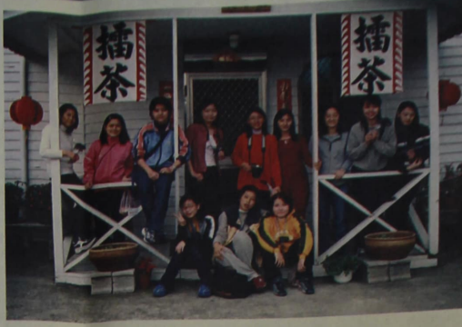
▲橋境攝影社於社區農園舉辦外拍活動。