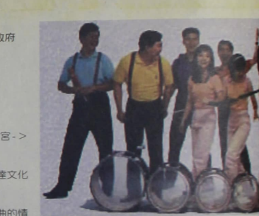
展覽日期：90年9月15日至9月30日