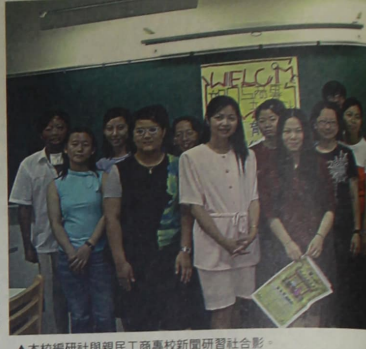
▲本校編研社與親民工商專科新聞研習社合影。