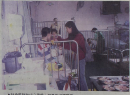
▲社會服務社於八里愛心教養院服務院童

(1)申請館際借閱(圖書)：讀者可至「NBINET」或它館之館藏查詢圖書資料，確定書目資料及收費單位後，再至圖書館辦理館際合作申請。 (2)申請館際複印：讀者可利用「中華民國期刊論文索引」、「中華民國博碩士論文摘要系統」、「OCLC-First Search」、「ABI/INFORM」等資料庫查詢資料，欲取得資料全文時，再至圖書館辦理館際合作申請。 (3)基於保護著作權，複印資料不得超過全書三分之一，並僅限個人研究用。 三、如何申請「館際合作」？ (1)資料來源： 圖書館向外申請館際合作資料時，可利用幾個途徑，一是遠距圖書服務系統、二是全國期刊聯合目錄暨館際合作系統、三是全國圖書目資訊網(NBINET)。 (2)申請館際合作者須先至圖書館辦理申請手續，並繳預付款(一份文件50元，圖書借閱100元)，申請文件費用將由此扣