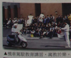
▲機車駕駛教育講習，寓教於樂。

最近本校學生在校外騎機車事故頻傳，生輔組為提升學生安全意識，宣導交通安全教育，特地舉辦機車安全駕駛教育講習，內容包括行車前車輛檢查要項、正確的騎乘姿勢、駕車方法、如何保持安全距離、轉彎時的操要領、狹窄、蛇形、轉彎等不負路況時的騎乘技巧，以及安全不良的處理等各項注意事項。駕教中心講師的生動講解，讓學生更了解騎機車的安全技巧。