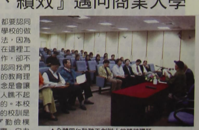
全體同仁聆聽王創辦人的精神講話

有主見，並且有決定權；屬員就要遵守主管的決定，並且努力執行勤務，即使自己有意見和看法，也要能夠體性、服從，因為主管必須就工作的結果負責。在我們中心，一切行事以校長為中心，校長則對創辦人負責。(二)要認真自己的職稱和工作內容。除了個人的職掌要明確以外，各單位之間更要相互支援與聯繫、摒除陳見、重視溝通；由於我們是新創立的學校，一切都在開始，如果我有必要，請各位能犧牲小我，以完成教育的大我事業。(三)對於主管交辦的事項一定要當做重要的事情按照法定的程序積極辦理；即使是創業者親自交辦，承辦者也是一定要按正式公文程序去處理的；進度則向自己的主管呈報，即使是小事，也不可忽視，必須爭取即時回報，落實分層負責的精神。 三、天氣漸漸回溫，環境衛生日形重要，請總務處隨時到餐廳巡視，發現問題，立即改進，學校有責任照顧學生的生活，所以飲食衛生和學生安全需要重視。 四、現在已經是育達技術學院第四學期的開始，但是我們仍然沒有建立自己的特色。因此，我們要全力推動「一分鐘環保」，用「一分鐘環保」的活動，使我們校園環境整潔乾淨，成為育達的一大特色。 五、廣亞要再次強調育達校的特色和精神是「愛國愛校、寧靜好學、禮讓整潔」，希望大家身體力行，讓外賓到校參觀時，能對我們產生良好的印象。而在我們學校中工作的每一個人，