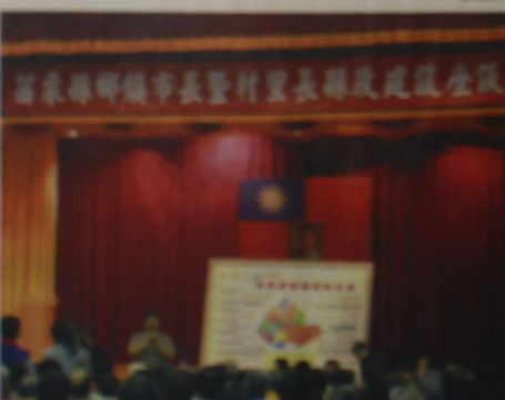
▲苗縣幹部假育達學院舉辦座談會。

【本報訊】苗縣縣長傅學鵬日前在育達學院舉辦座談會，邀請苗縣18鄉鎮市幹部參加。座談會中，傅縣長針對鄉鎮市首長提出的相關提問，一一進行解答。傅縣長表示，政府將致力於改善鄉鎮市的基礎建設，並促進鄉鎮市的經濟發展。座談會在熱烈的氣氛中圓滿結束。