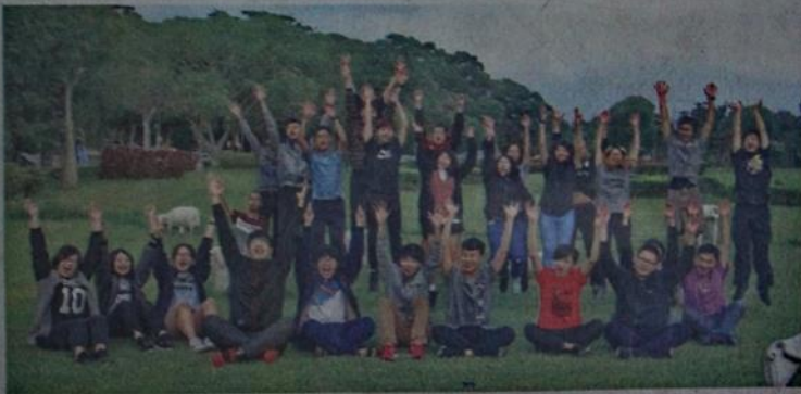
●育達科技大學美麗校園與學生活力。

因應少子化衝擊，學校積極進行教學創新與經營轉型。107學年成立了附屬廣秀森林幼兒園，亦經營新北市三多非營利幼兒園及苗栗縣後龍非營利幼兒園，未來規劃成立中小學。首創全臺第一座大學C級巷弄長照站「育達樂齡生活棧」，結合學校健康照顧社會工作系師資與設備，創造銀髮族樂居好環境，蔚為全台之光。讀育達科大服務的對象從幼兒到青年，進而延伸到長輩，善盡私人興學的社會責任與義務。因此育達科技大學王育文董事長繼創辦人王廣亞博士榮獲第一屆傑出教育事業家獎，獲頒第六屆傑出教育事業家獎，見證育達教育集團蓬勃發展與