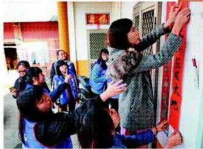
◆同學們幫長輩張貼春聯，增添年節喜氣。

家住平興村山上的90歲黃阿公看到這麼多孩子「阿公!阿公!」叫個不停，讓黃阿公都忘了孤單的感覺，他說他第一次看到這麼多的年輕人圍繞在