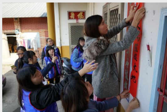
育達科大師生們幫長輩張貼春聯，增添年節喜氣。