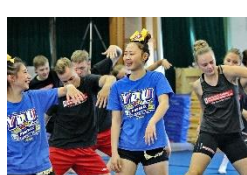
丹麥體操隊選手與育達科大學生互動學習 圖／育達科大 提供