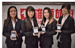
育達科大與雄獅旅行社產學合作，打造「實習旅行社」培養領隊導遊達人

育達深耕苗栗，鏈結在地產業，接軌國際，目前來自越南、印尼及菲律賓等國的外籍學生已增至 351 人；學生赴海外交流比率全國第一，每年選送上百名學生至美、日、澳等國進行海外實習、參訪研修或志工服務，拓展國際視野，還可選讀名古屋產業大學等姊妹校的雙聯學制，取得學碩博士雙文憑，為自己優勢再加分。