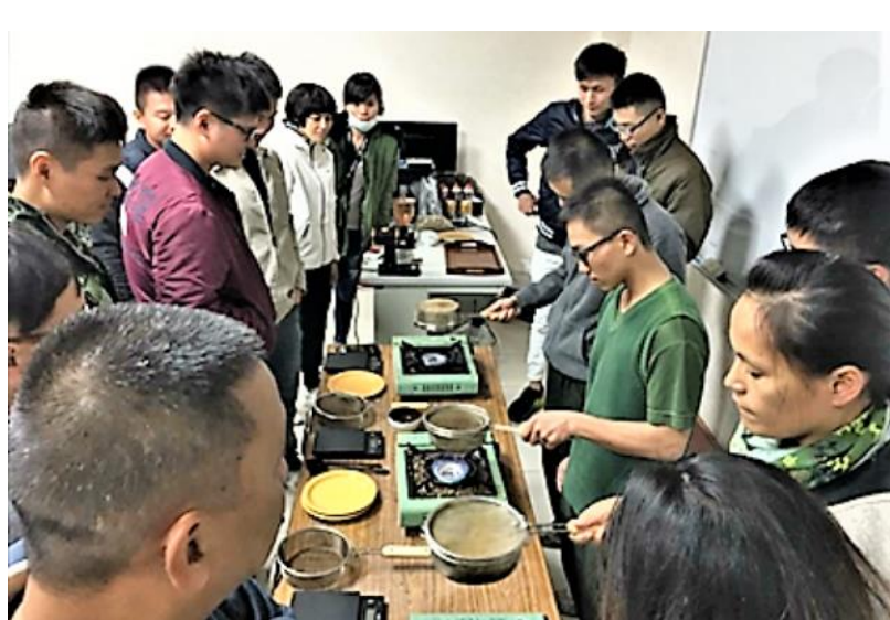
圖為育達科大於營區教學點教授咖啡概論課程。

https://money.udn.com/money/story/5710/2974444